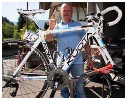
SRAM Apex, genehmigt von Gadrets Mechaniker!