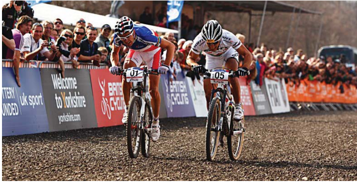
Dalby Forest, 25 April 2010: Nino Schurter sprintet zum Sieg!

Schurter, Hermida und Absalon waren die dominierenden XX-Fahrer beim Weltcup 2010