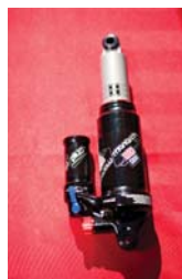
Die RockShox Dämpfer Monarch, Vivid Air und Monarch Plus für 2011