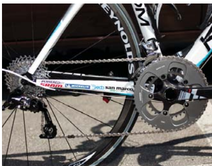
Die kleinste Übersetzung des Tages: 34T x 32T!

Spannende Geschichten aus dem SRAM Rennalltag finden Sie unter: www.theroaddiaries.com .